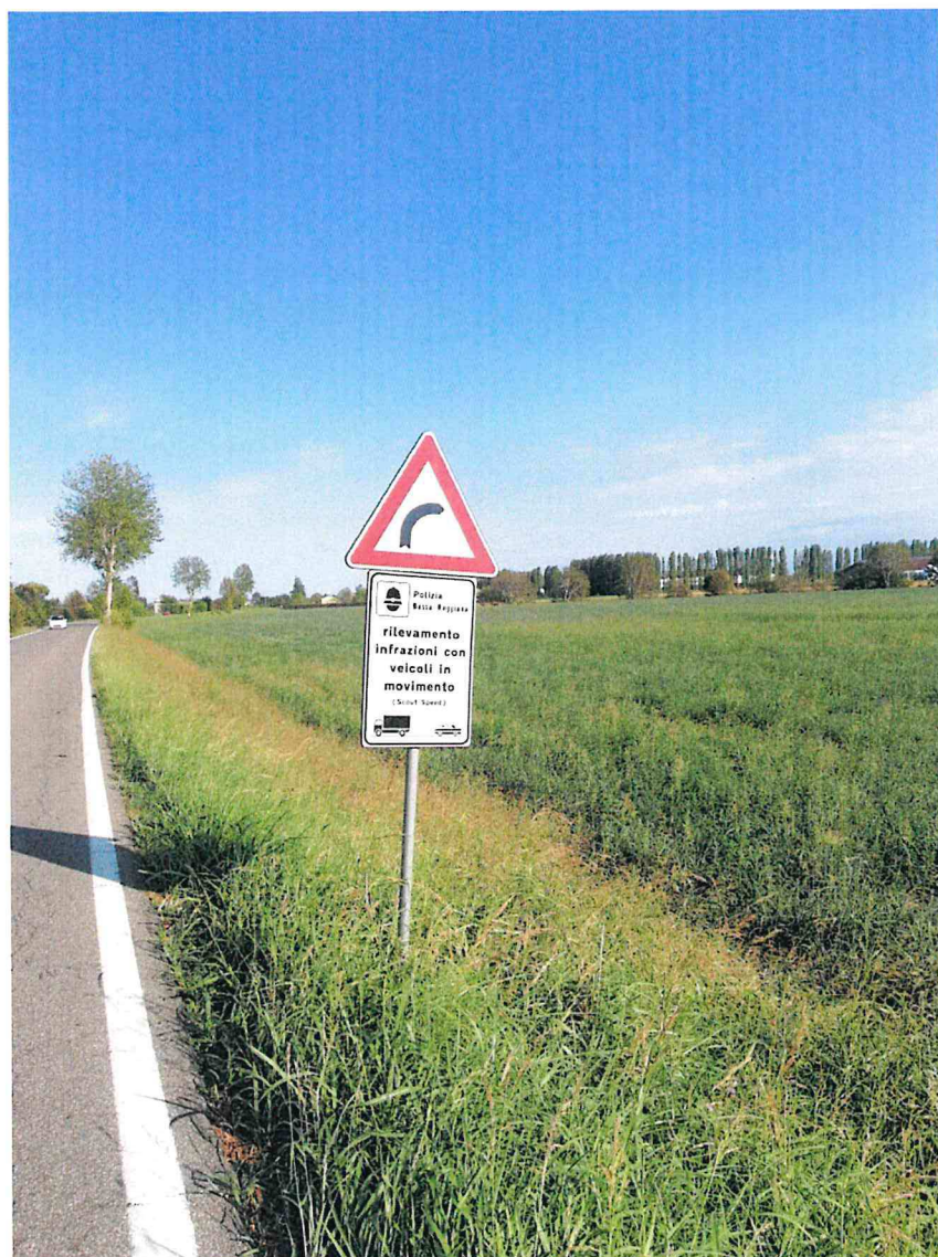
2. SP 2 KM 3+500 DIR. REGGIOLO