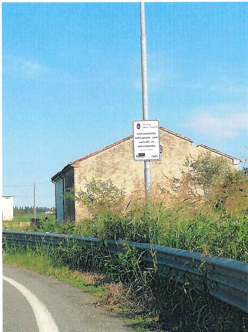
3. SP 2 KM 2+500 DIR. REGGIOLO